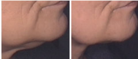
TO ERSTE ANWENDUNG